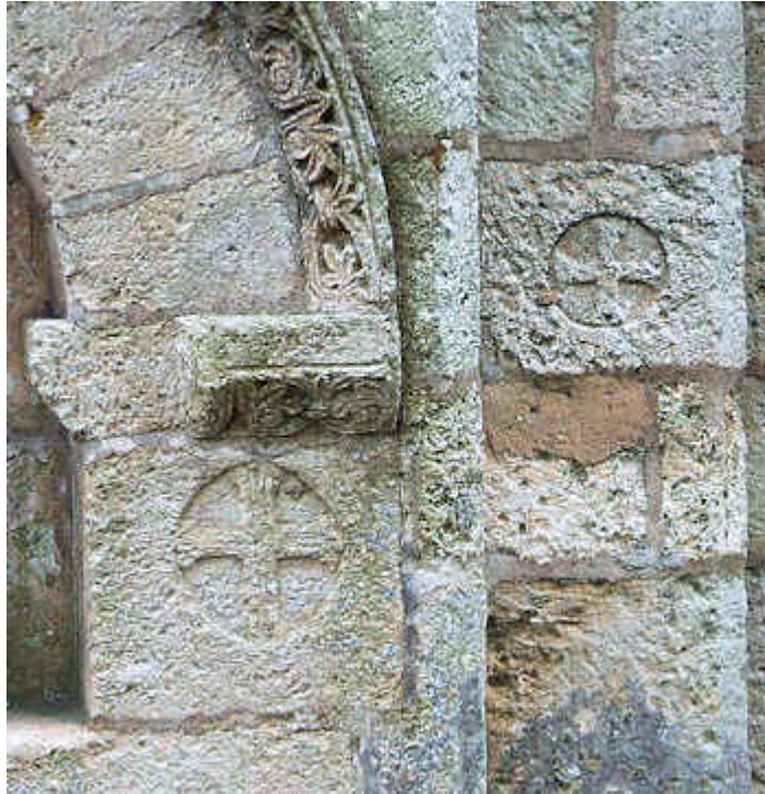
Maison du Temple de Charmant

L'opposition entre les différentes parties de l'édifice est frappante. Il est donc possible d'admettre que, primitivement, la nef reconstruite par les Templiers, leur avait servi de chapelle et que, par dérogation, quand le sanctuaire devint commun à la paroisse, ces derniers consentirent à y ajouter un transept et un chœur conformes aux traditions locales. La présence du clocher, comme au Grand Mas-Dieu, renforce l'hypothèse.