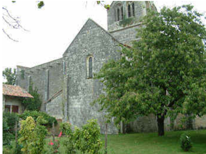
Maison du Temple de Charmant - Source image Jack Bocar

Aucun texte ne permet de le dire, mais l'examen du monument le laisse supposer.