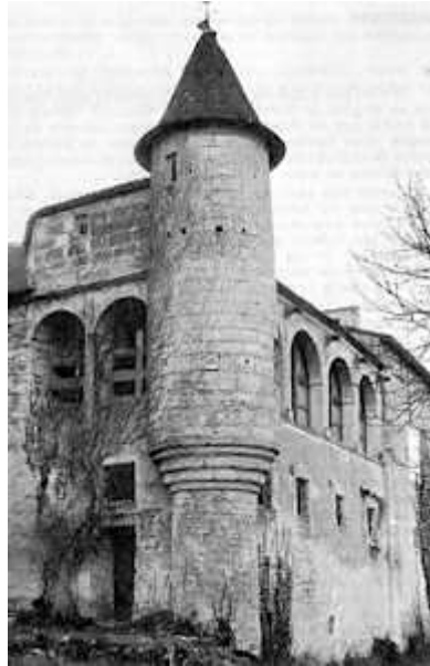
Maison du Temple de Charmant

Comme à l'habitude, le logis du gouverneur était situé près de la chapelle, au nord. Il a été intégré dans la construction d'un château construit pendant les dernières années du XVI e siècle. On peut y voir quelques vestiges, notamment un contrefort percé d'une ouverture étroite ressemblant à une meurtrière, à la face septentrionale, et une tour en encorbellement à l'angle nord-est.