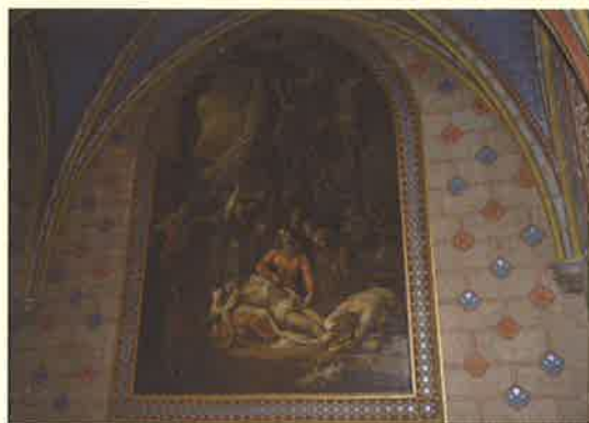
TABLEAU La descente de croix d'Antoine COLIN 1852