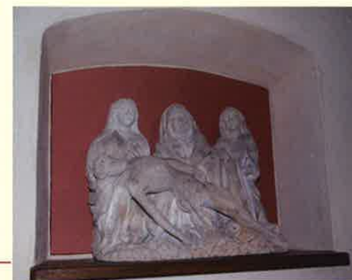
PIETA XIV ème siècle représente une des 7 douleurs, celle pour la mère de recevoir sur ses genoux le corps de son fils. Elle est entourée de Saint Jean et Sainte Madeleine.