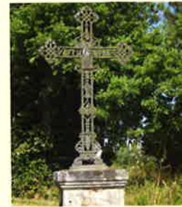
Croix de SISSAN