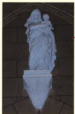
STATUE VIERGE A L'ENFANT