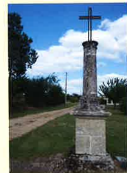
Croix de CHARDAVOINE