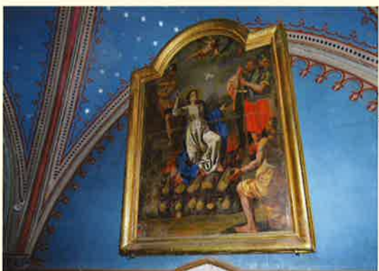
TABLEAU Le Martyre de SAINTE EULALIE Née à MERIDA (Espagne) et brûlée en 303 à l'âge de 12 ans.