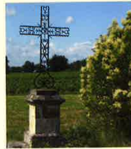
Croix de BEYLOT