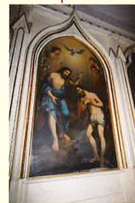
TABLEAU LE BAPTÊME DU CHRIST