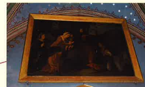
TABLEAU Hommage d'un Berger à la SAINTE FAMILLE de LE CHEVALIER 1851