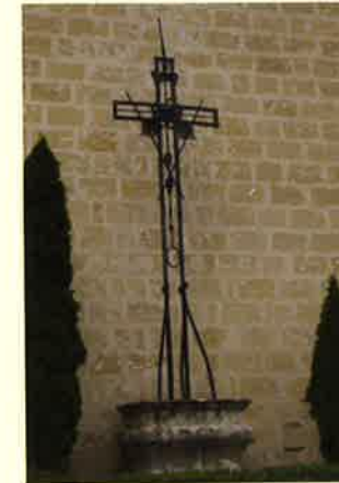
Croix du Chevet de l'église XVIII ème Siècle

En fer forgé, œuvre locale des artisans, elle fut placée en 1779 dans l'ancien cimetière. Les principaux instruments de la Passion y sont représentés.