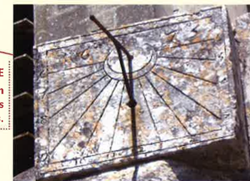
CADRAN SOLAIRE 1673 longtemps seul moyen de connaître l'heure pour les habitants.