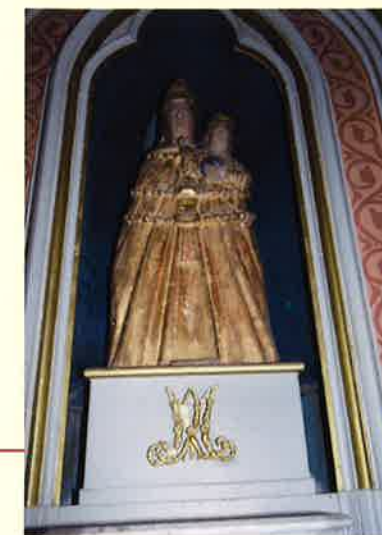
STATUE NOTRE-DAME DE LORETTE rapportée d'Italie par François de RAYMOND en 1611