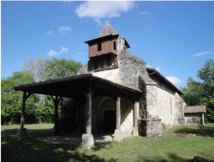
Chanelle Notre-Dame de Rétis - Hostens