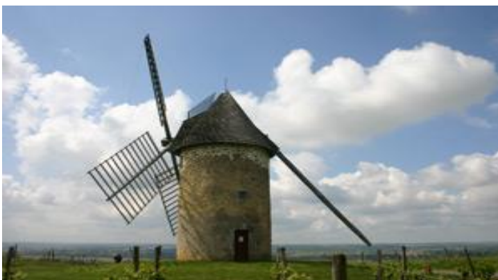
Photos du moulin provenant du site Caruso 33

Les plus courageux pourront terminer par le musée d'Art Sacré.