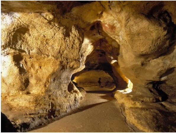
Grotte de Pair non Pair