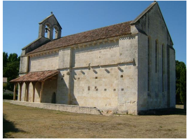
Chapelle templière de Magrigne