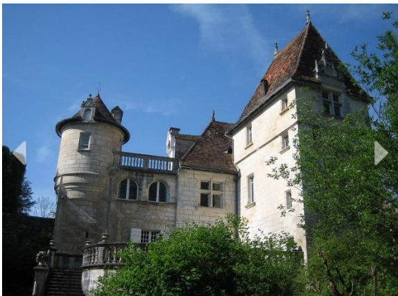
Le château de la Hierce