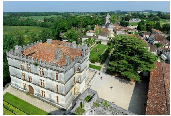
Partie nouvelle du château