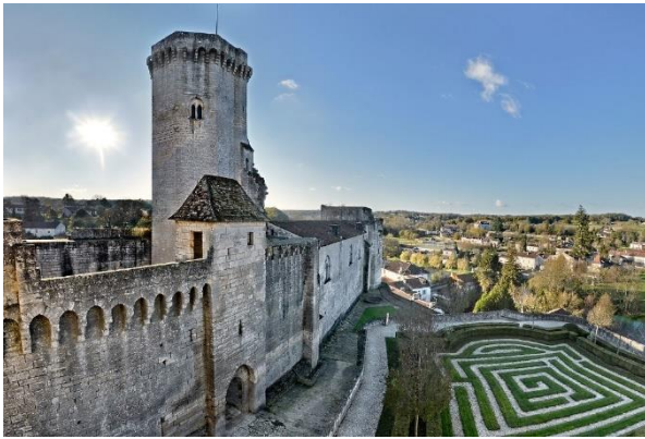
Partie ancienne du château