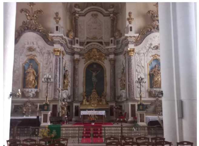
L'autel de l'église de Barsac

L'église primitive remonte au XI e siècle. Elle est reconstruite au XV e siècle. Une nouvelle église est projetée et les travaux commencent en 1702 sous la conduite de l'architecte Claude Joyneau. Cette église de type « halle », est de plan massé en croix latine. De nouveaux travaux sont entrepris à partir de 1752, tribune, autels, retables et décors.